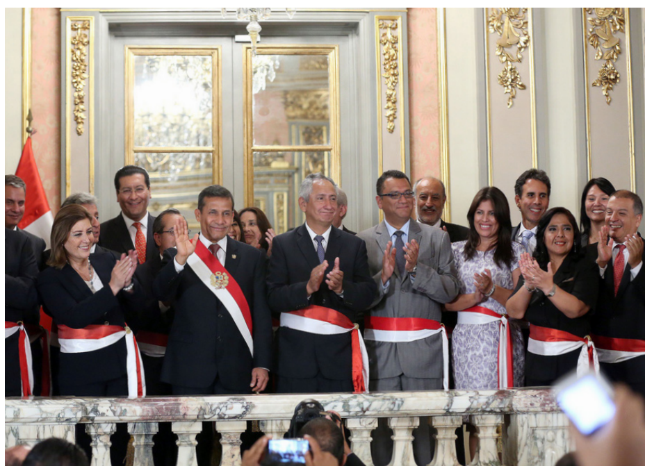
Nuevo Gabinete Cornejo

El representante del gremio empresarial destacó el perfil técnico y profesional de Cornejo y su nuevo equipo ministerial, y dijo que de esta manera se consolidan los objetivos del Ejecutivo en lo que se refiere a lucha contra la pobreza y crecimiento económico. “Los Ministros que han sido nombrados tienen un perfil (adecuado para) poder manejar cada una de sus carteras de la manera más técnica y profesional(...) son profesionales de calidad, tenemos la mejor de las expectativas de lo que puedan hacer”, afirmó.