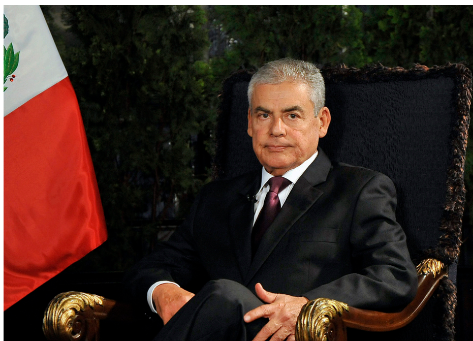
Premier Saliente César Villanueva

El ingeniero inició su carrera profesional en Petro-Perú, donde entró a trabajar en 1969.