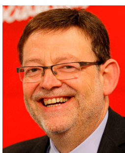
XIMO PUIG (Castellón, 1959) Secretario de Reformas Democráticas

En 2004 fue elegida diputada al Congreso por la provincia de Valencia y reelegida en 2008 y nuevamente en 2011. Fue la ponente de la ley que permitió el matrimonio entre personas del mismo sexo y de la de identidad de género.