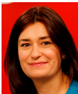
CARMEN MONTÓN (Burjasot, Valencia, 1976) Secretaria de Igualdad

Licenciada en Medicina. Diputada por Valencia. Ha sido portavoz del Grupo Socialista en la Comisión de Igualdad, miembro del Comité Federal del Partido Socialista y Coordinadora Federal de la Sectorial de Participación Ciudadana PSOE.