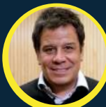
FAACUNDO MANES 1ER CANDIDATO A DIPUTADO POR PBA