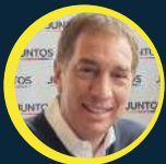
DIEGO SANTILLI 1ER CANDIDATO A DIPUTADO POR PBA