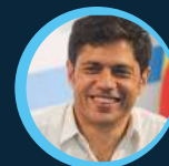
AXEL KICILLOF GOBERNADOR DE PBA

Sus dos primeros años como Gobernador se vieron condicionados por la pandemia. Si bien ha contado con el respaldo constante de Cristina Kirchner, no se vio una gran influencia de él en la elaboración de las listas.