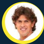
MARTIN LOUSTEAU SENADOR aPOR CABA