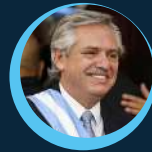
ALBERTO FERNÁNDEZ PRESIDENTE

Tras alcanzar una imagen positiva de 93,8% en abril de 2020, gran parte del año pasado y todo el 2021 han significado una erosión de la confianza de la ciudadanía en su figura. Sin embargo, impuso a las cabezas de lista de PBA y CABA.