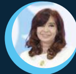
CRISTINA KIRCHNER VICE PRESIDENTE

Después de coordinar el FdT e imponer la postulación de Alberto Fernández en 2019, estos dos años lució más enfocada en la PBA y en el Congreso. Se enfocó en mantener el poder en áreas clave como Justicia, Energía y Seguridad Social.