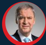
JUAN SCHIARETTI GOBERNADOR DE CÓRDOBA

Sin chance de reelección como Gobernador de Córdoba en, se mantiene independiente del oficialismo y de la oposición. Presenta a sus candidatos por fuera de JxC y el FdT.