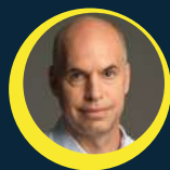
HORACIO RODRÍGUEZ LARRETA JEFE DE GOBIERNO - CABA

Decidió competir en internas de JxC, permitiéndole a la coalición la posibilidad de retener votos de "derecha" y contrarrestar el peso de otras figuras, como la de Javier Milei.