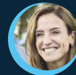
VICTORIA TOLOSA PAZ 1º CANDIDATA A DIPUTADA POR PBA

Cercana a Alberto Fernández, mantuvo un rol de Gobierno y mediático importante a través del Consejo Nacional de Coordinación de Políticas Sociales.