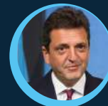
SERGIO MASSA PRESIDENTE DE LA CÁMARA DE DIPUTADOS

Actor decisivo en las elecciones de 2019, se abocó a la Presidencia de la Cámara de Diputados, desde donde forjó diversos acuerdos y fortaleció su figura de político conciliador. Ha logrado establecer una buena relación con el kirchnerismo duro, encabezado por Máximo Kirchner.