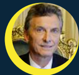
MAURICIO MACRI EXPRESIDENTE