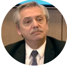
Alberto Fernández Presidente

De raíces peronistas y conciliador hacia el interior del Partido Justicialista, Alberto Fernández se desempeñó como jefe de Gabinete de Ministros entre 2003 y 2008 durante las presidencias de Néstor Kirchner y Cristina Fernández de Kirchner. Abandonó sus funciones al momento en que Cristina Fernández radicalizó su posición con respecto a los medios de comunicación (principalmente el multimedio Grupo Clarín) y al sector agro-ganadero. A partir de ese momento, fue Jefe de Campaña de diversos políticos que, de igual manera que él, rompieron con el kirchnerismo.