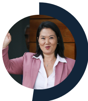
Keiko Fujimori Fuerza Popular 50,13 % 9,223,396 votos